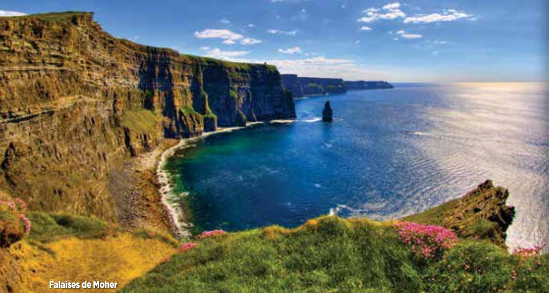
Falaises de Moher